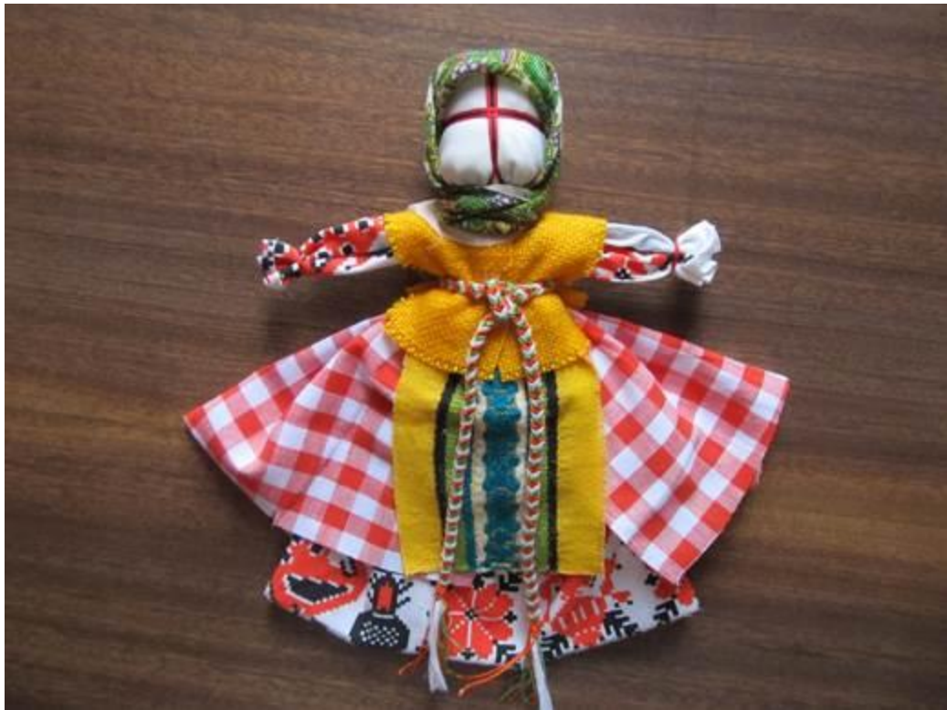
35. Лялечка готова.

Традиційна лялька – це пам'ять культури, яка втілена в ній набагато яскравіше, ніж у будь-якій іншій іграшці. У ній збережені традиції в одязі, вишивці. А ще домашня лялька, зроблена власноруч мамою чи бабусею, несе в собі потужний заряд духовної енергії роду, і її зовсім не порівняти із сучасною масовою іграшкою з пластику! Рукотворна клаптикова фігурка виконує тепер провідникову функцію між минулим і майбутнім. На зорі існування людства лялька-мотанка носила ритуальний характер, брала участь у різних обрядах і святах. Як іграшка така лялька цінна своїми виховними властивостями. Це унікальний приклад, на якому дитина ще змалку привчається до художньої праці, декоративно-прикладного мистецтва і текстильного дизайну.